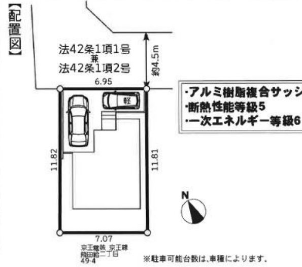
※駐車可能台数は、車種によります。

※上記標準仕様は予告なく変更する場合があります。 ※詳細仕様については、申込前、契約前に「仕様書」をご参照下さい。