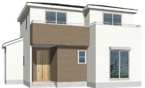
※完成予想図/このパースは図面を基に描いたもので実際とは多少異なる場合がございます。