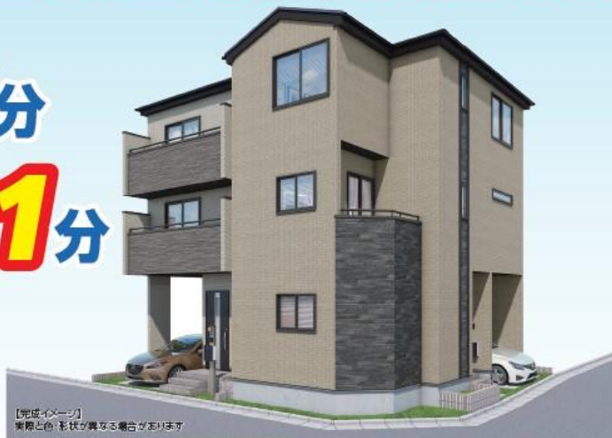
【完成イメージ】 実際とは、形状が異なる場合がございます