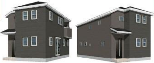
※写真イメージ/このパースは図面を基にしたもので実際とは多少異なる場合がございます。

物件番号 8520-7BE8 | 情報公開日 2024年09月18日 | 広告有効期限 2024年10月03日 | 仲介手数料無料+期間限定キャンペーン実施中!