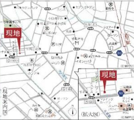
Car navigation 春日部市増田新田391-14

Life information 武里西小学校.....1,500m(徒歩19分) 春日部南中学校.....683m(徒歩9分) スーパーバリュー春日部大場店...250m(徒歩4分) セブンイレブン春日部大場店...510m(徒歩7分) ドラッグセイムス春日部大場店...1,379m(徒歩18分) 医療法人光仁会南部厚生病院...417m(徒歩6分)