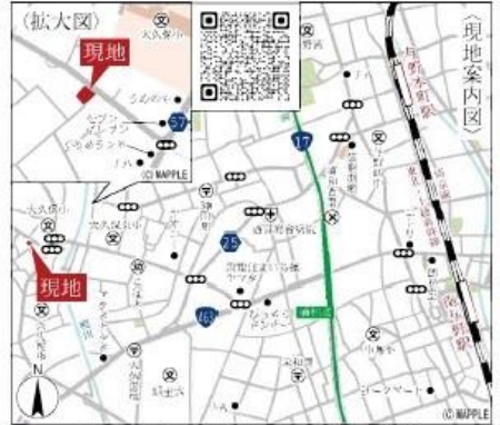
Car navigation さいたま市桜区五関851付近

【物件概要】所在地/〔地番〕埼玉県さいたま市桜区大字五関字水入851番1-1(住居表示)埼玉県さいたま市桜区五関851-1土地権利/所有権口地目/宅地口総棟数/8棟口販売棟数/5棟口建物構造/木造在来軸組工法2階建(910モジュール)口都市計画/市街化調整区域口用途地域/無指定口建ぺい率/60%口容積率/200%口設備/東京電力・個別LPG・公営水道・本下水口道路状況/北東側7.73m公道・南東側4m公道・北西側6m私道口現況/更地口完成/2024年5月下旬引渡日/2024年6月中旬引渡日/計画決定口備考/※広告の取扱いに関しましては法令遵守にてお願いたします。※転戸・照明・満棟・カーテンレール・防水パン・カーポートはオプションとなります。※宅内に電柱及び支線が入る場合があります。※司法書士は、当社指定になります。※図面と現況に相違がある場合は現況優先とします。広告有効期限/2024年3月31日