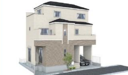
イメージパースはあくまでイメージです。実際とは多少異なります。

LDK・水回り(洗面所・浴室・トイレ)を2階にまとめた便利で暮らしやすい間取りが魅力の3階建。 寝室はライフプランにあわせた可変型プラン採用。 住宅性能評価W取得!省エネ性能表示制度・BELSで最高等級の5つ星認定!耐震等級3(最高級)・断熱等性能等級5の永住邸!