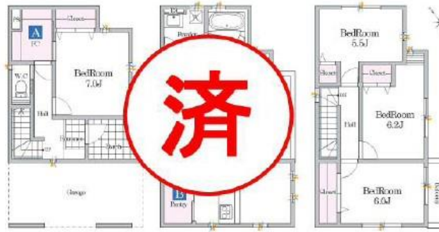
1階 41.88㎡ 2階 41.31㎡ 3階 38.88㎡