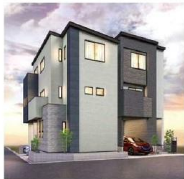
外観(仮想像図) ※外観・構図はイメージであり施工上の都合により変更となる場合がございます。