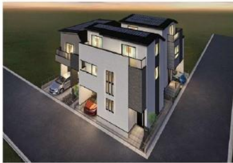
外観完成イメージ ※外観・価格はイメージであり施工の場合により変更となる場合がございます。