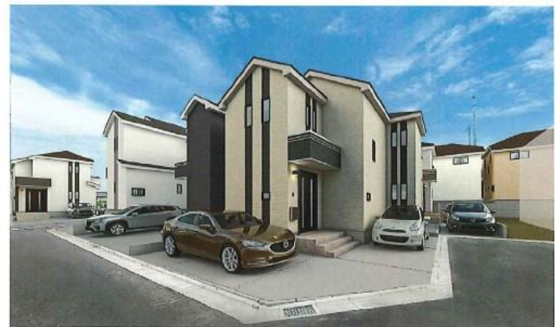
※イメージパース 実際のものとは色仕仕後デザイン等変更する場合がございます。