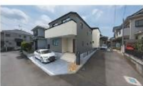
※図面と現況に相違がある場合は現況優先とします。