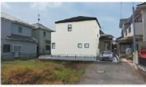
※図面と現況に相違がある場合は現況優先とします。