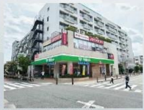
サミットストア芦花公園駅前店

物件番号 45B8-7D84 情報公開日 2024年09月07日 広告有効期限 2024年09月22日 仲介手数料無料+期間限定キャンペーン実施中!