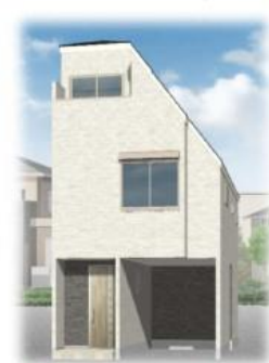
※A棟外観イメージパース