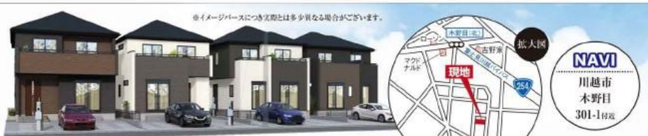
※イメージベースにつき実際とは多少異なる場合がございます。