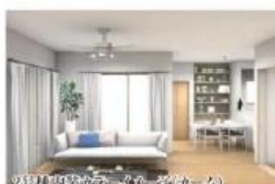
2号棟内装カラーコーディネート

パースはイメージ図です。現況と異なる場合は現況優先させていただきます。アクセントクロスはカーテンは異なります。また、間取りも本物件とは異なります。