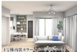
1号棟内装カラーコーディネート

パースはイメージ図です。現況と異なる場合は現況優先させていただきます。アクセントクロスはカーテンは異なります。また、間取りも本物件とは異なります。