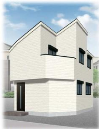
※外観イメージバース

南側と西側が接道している角地のため、全ての居室が道路に面する配置とし、光の注ぐ間取りとしています。南側道路に面したりビングの天井高さを3mと高くし、より開放的な空間となるように計画しました。