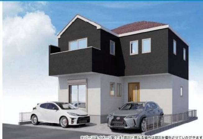
図1-1はイメージ図です。現況と異なる場合は現況を優先させていただきます。