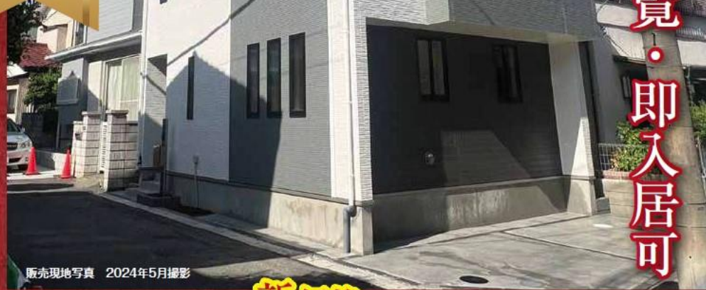
販売現地写真 2024年5月撮影

2024 サマー キャンペーン 30万円相当分 【キャンペーン期間】2024年7月1日(月)～2024年8月31日(土) 詳しくは営業担当にご確認ください