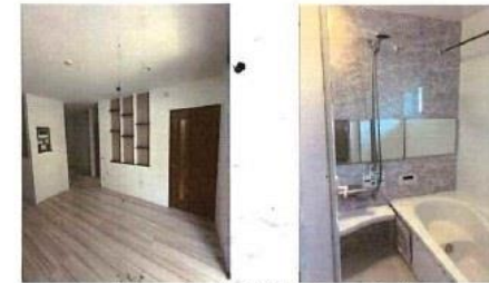
※イメージ写真(実際とは異なります)