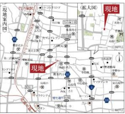
Car navigation 東京都足立区六月2-5-5

1号棟 3SLDK ■土地面積:59.89㎡ ■建物面積:105.69㎡ ■私道面積・持分:12.08㎡×1/7 ■建築確認番号:第24UD11W建03309号(令和6年8月3日)