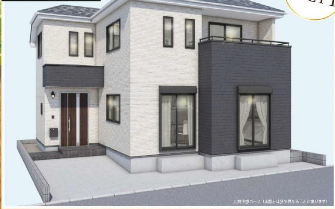
完成予想パース（実際とは多少異なることがあります）