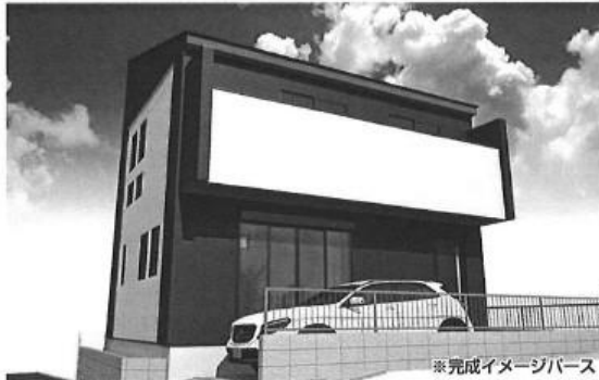
※完成イメージパース