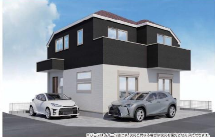
※パースはイメージ図です。現況と異なる場合は現況を優先させていただきます。

内装イメージ(スマート) パースはイメージ図です。現況と異なる場合は現況優先させていただきます。アクセントクロスは異なります。また、間取りも本物件とは異なります。