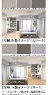
1号棟 内装イメージ (スマート) 2号棟 内装イメージ (カーム) 写真はイメージです。現況と異なる場合は現況優先させていただきます。 アクセントクロスは異なります。 また、現況も本物件とは異なります。