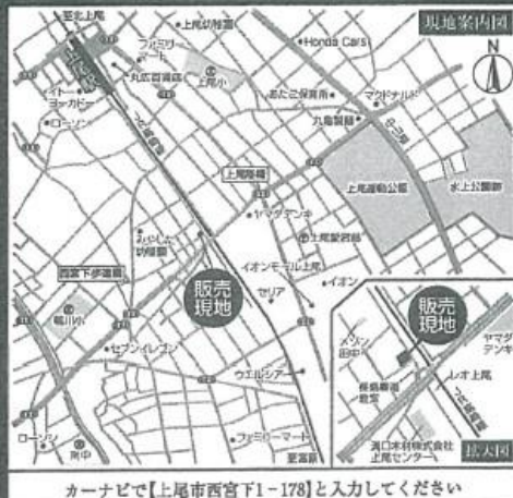
カーナビで【上尾市西宮下1-178】と入力してください