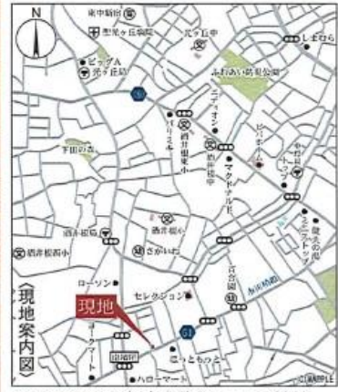
Car navigation 柏市青葉台1丁目14付近