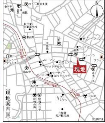
Car navigation 千葉県松戸市五香3-9-2

1号棟 ■土地面積:101.16㎡ ■建物面積:116.75㎡ ■建築確認番号:第23UD11W建05753号(令和5年12月9日) 4LDK