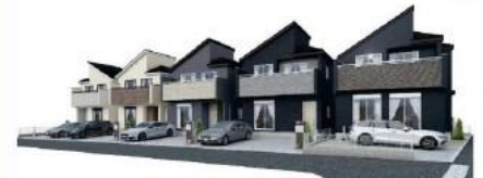
イメージベース ※このイラストは図面を基に描きおこしたもので実際とは多少異なります。

JR常磐線(各駅停車) 「南柏」駅まで バス10分 バス停「光ヶ丘中学校」まで 徒歩2分 東武アーバンパークライン 「増尾」駅まで バス10分 バス停「光ヶ丘中学校」まで 徒歩2分