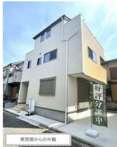
南西側からの外観

全洋室6帖以上の広さを確保した4LDK+バルコニー2箇所プラン! 2階にLDKと水廻りを集中し、1階と3階に独立した2つの居室を設けた間取 明るい洗面スペースで身支度や洗濯時間も気分よく行えそうです。 ぜひご内覧のうえ、ご検討ください🏠