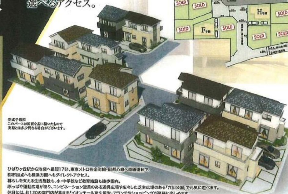
完成予想図 このパースはイメージを基に描いたもので 実際とは多少異なる場合がございます。