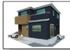
完成予想バース(外観)