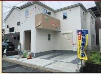
物件完成写真(外観)