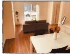
物件完成写真(リビング)

私はサウナも大好き!そんなあなたがゆったりした家時間を過ごせる素敵な新居です! 駐車場3台!!(車種による)と大きなLDKが魅力の2階建て住宅をぜひご覧ください。