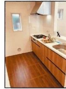
物件完成写真(キッチン)