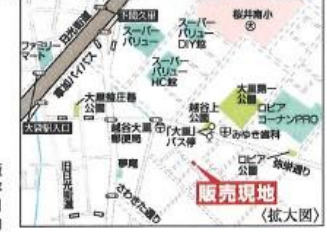
Car navigation 越谷市大里248-3