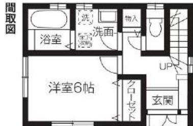
物件概要 ▲1F 28.15㎡