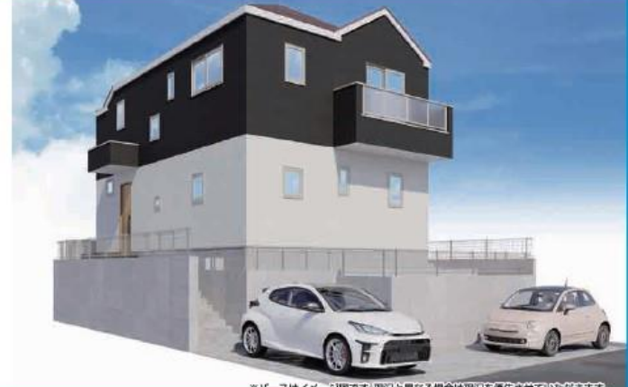
※パースはイメージ図です。現況と異なる場合は現況を優先させていただきます。