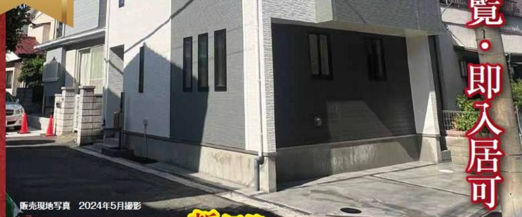
販売現地写真 2024年5月撮影

サマー2024 30万円相当分 【キャンペーン期間】2024年7月1日(月)～2024年8月31日(土) 詳しくは営業担当にご確認ください