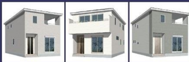
1号棟 2号棟 3号棟