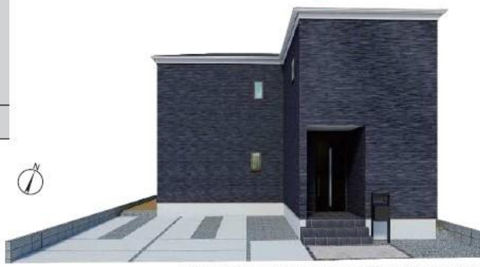
※実寸参照/このパースは図面を基に描いたもので実際とは多少異なる場合がございます。

物件番号 150C-2F08 | 情報公開日 2024年07月01日 | 広告有効期限 2024年07月16日 | 仲介手数料無料+期間限定キャンペーン実施中!