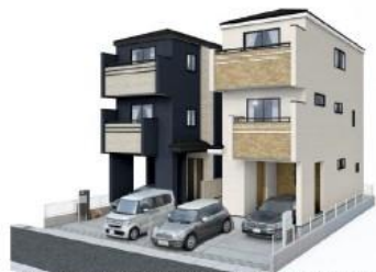
イメージパース※このイラストは図面を基に描きおこしたもので実際とは多少異なります。

住宅性能評価W取得!耐震等級3(最高等級)の永住邸 こだわりの仕様(ポップアップ天井、食洗機、玄関カードキー(電池錠))