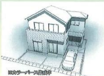
図例イメージ(車種等)