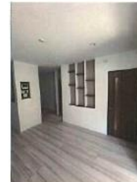
※イメージ写真(実際とは異なります)