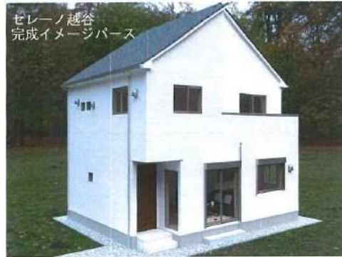
セレーノ越谷 完成イメージパース