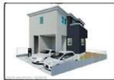
完成予想パース(外観)