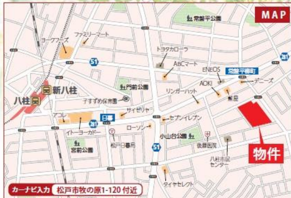
カーナビ入力 松戸市牧の原1-120 付近