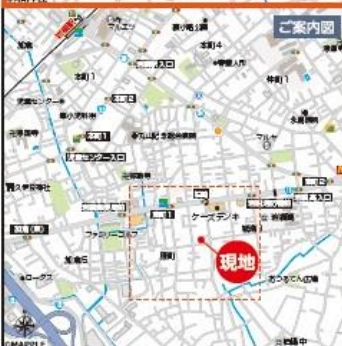
カーナビ入力 埼玉県さいたま市岩槻区原町1-36

東武アーバンパークライン「岩槻」駅歩17分 土地広43坪!カースペース4台可(小型車含)!! 南公道・陽当良好☀️🎵