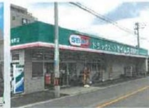
ドラッグセイムス奈良町店