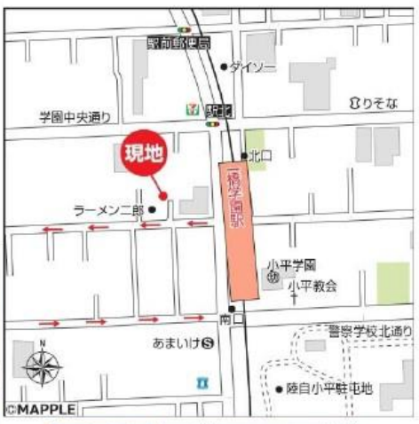
カーナビ入力 小平市学園西町2-13-3付近