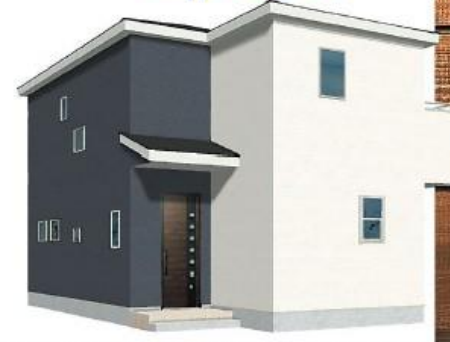
※完成予想図/このパースは図面を基に描いたもので実際とは多少異なる場合がございます。