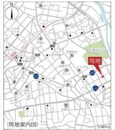
Car navigation 岩槻区城町2-10-28付近

(物件概要) 所在地/埼玉県さいたま市岩槻区城町2-1669(地番)、埼玉県さいたま市岩槻区城町2丁目10-28(住居表示) 土地権利/所有権口地目/宅地口総棟数/9棟口販売棟数/9棟口建物構造/木造在来軸組工法2階建(910モジュール)口都市計画/市街化区域口用途地域/準工業地域口建ぺい率/60%口容積率/200%口設備/東京電力・都市ガス・公営水道・下水道口接道状況/北西側約5.0~6.0m公道・中央側約4m公道・北東側約5.0m公道口現況/建築中口完成/2024年8月上旬引渡日/2024年8月下旬引渡日/※広告の取扱いに関しては法令遵守にてお願いいたします。※新戸・照明・浴槽・カーテンレール・防水パン・カーポートはオプションとなります。※宅内に電柱及び支線が入る場合があります。※司法書士は、当社指定になります。※図面と現況に相違がある場合は現況優先とします。広告有効期限/2024年6月30日