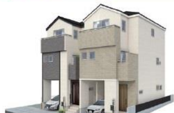
この一戸建ては新築にこだわっているため、実際の仕上がりとなる場合がございます。

住宅性能評価W取得とBELS評価書取得!!断熱等性能等級5取得！ 耐震等級3(最高等級)の永住邸！こだわりの仕様(ポップアップ天井・食洗器・玄関カードキー(電池錠))