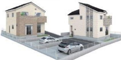
このバスは図面を基に作成されているため、実際の仕上がりとは異なる場合がございます。