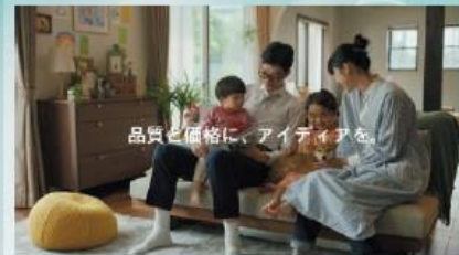
品質と価格に、アイデアを。